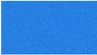
Aero Blue Metallic