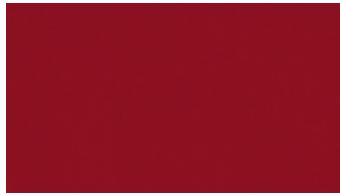
Blaze Red Crystal Metallic