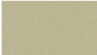
Oyster Gold Metallic